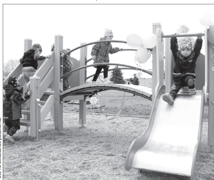
Foto no atklāšanas pasākuma.

2017. gadā tika veikti zemes darbi, laukuma pamatnes un seguma izbūve, bet 2018. gadā pārvaldes budžetā tika plānoti līdzekļi rotaļu iekārtu iegādei un uzstādīšanai. Nu laukums aprīkots ar iekārtām, kas piemērotas dažāda vecuma bērniem – gan pavisam maziem, gan lielākiem. Talkas dienā rotaļu laukumā nolīdzināja melnzemi un iesēja zāli, lai vasarā šis stūrītis skaisti zaļotu.